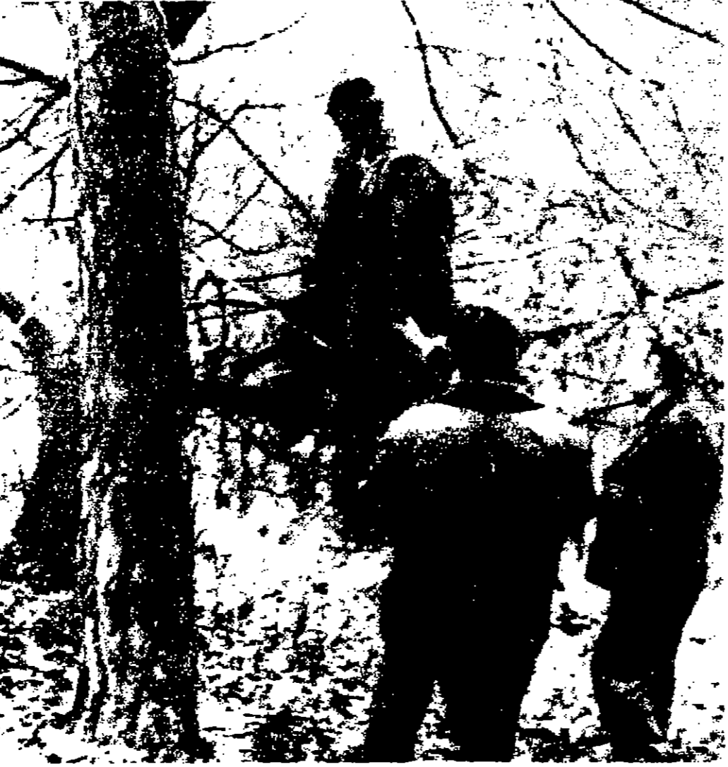
جناب كنع جرف برصاصي نائب رئيس الحكومة الكنعانية يستعرضها - مع ان عزته